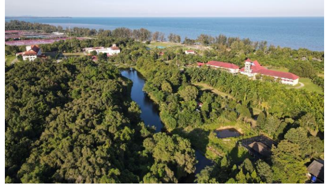
รูปภาพชุดที่ 2 ป่ากระถินเทพา