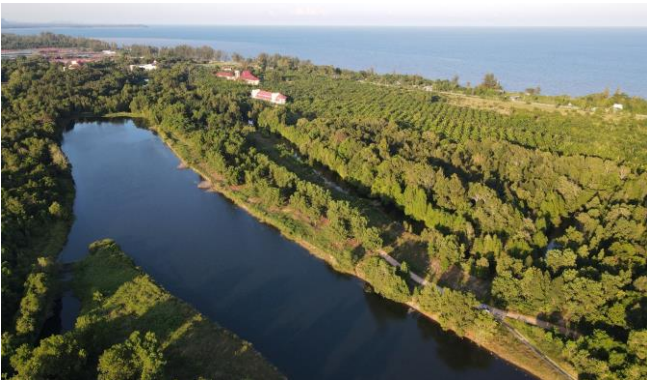
รูปภาพชุดที่ 1. บริเวณโครงการ ป่า 3 อย่าง ประโยชน์ 4 อย่าง แม่โจ้ - ชุมพร