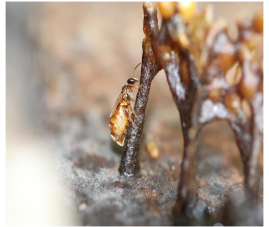
รูปภาพชุดที่ 4 โครงการไม้เพื่อน้อง